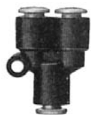
RACCORD EN Y