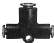
RACCORD EN T