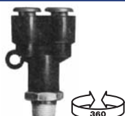
RACCORD EN Y PIVOTANT