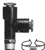
RACCORD MÂLE EN T PIVOTANT