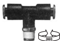
JONCTION MÂLE EN T PIVOTANT