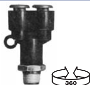
RACCORD EN Y PIVOTANT