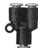
RACCORD EN Y