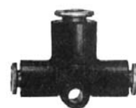
RACCORD EN T